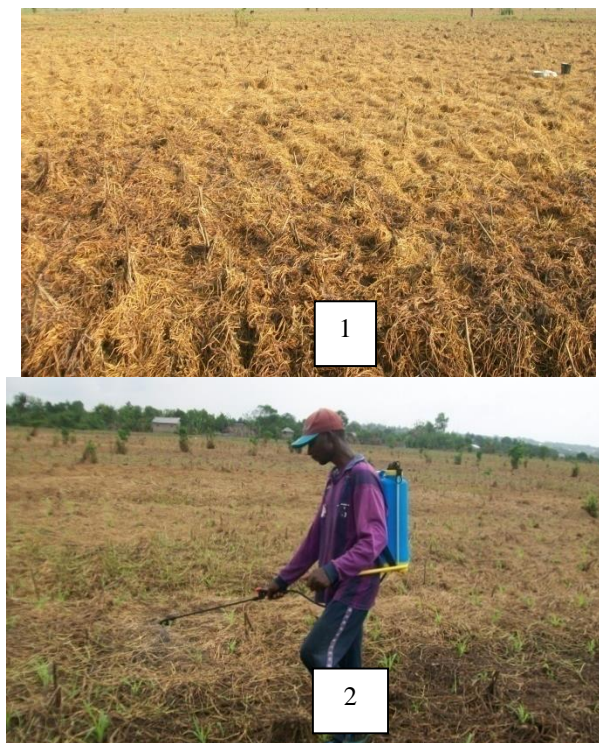
Planche 1. Champs asséché par l’herbicide total (1) et pulvérisation de l’insecticide sur le maïs à Gangban-centre (2) Prise de vues : Abou, janvier 2017

Cet indicateur varie de 0 à 10 points avec une moyenne de 2,8. Ce faible score confère une forte pression polluante (comprise entre 4 et 6) des pesticides sur les périmètres aménagés. Ces exploitants agricoles ne font aucune lutte biologique sur la surface utilisée. Une pratique qui ne garantit pas à court et à long terme la protection de la ressource sol. Par ailleurs, l’indicateur gestion des ressources en eau contribue à la durabilité avec un score de 5,8 sur 10 points. En effet, 97 % des enquêtés pratiquent l’aménagement hydro-agricole par irrigation dans les casiers rizicoles et l’aménagement hydro-agricole par drainage aux alentours des cultures irriguées.