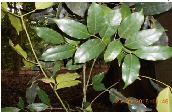
Figure 1 : Rameau feuillé de Hunteria eburnea , (Issia, 2015)

Le matériel végétal utilisé est constitué des écorces de tronc de Hunteria eburnea récoltées dans le Département d'Issia dont l'identification a été faite par comparaison avec un échantillon de l'herbier du Centre National de Floristique de l'Université Felix Houphouët Boigny (Abidjan Côte d'Ivoire) sous le numéro 15904 ( Forêt du Banco, 01 /06/1981, Aké-Assi L).