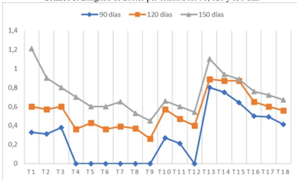
Gráfico 3. Longitud de Brotes por estaca a los 90, 120 y 150 días

Al haber realizado la Prueba de Tukey al 5% de la longitud de brotes a los 90 días, los tratamientos que contenían paja de páramo + tierra de páramo en combinación con las dosis media y alta de ácido \alpha Naftalenacético que son los número 13 y 14 son los que mayores longitudes registraron, siendo estas de 0.8 y 0.7 cm respectivamente.