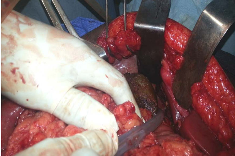
Photo3. Nécrose d'une partie du segment 6 du foie secondaire à une plaie par arme à feu chez un patient référé de la région de Diffa où sévit l'insurrection de Boko Haram.

jeune de sexe masculin ; ainsi l'âge moyen des patients de notre série était de 28 [ \pm 10,2 ] ans avec 58,82 % des patients qui étaient âgés de moins de 30 ans. Ces plaies pénétrantes de l'abdomen étaient dues pour 60,79% aux agressions par arme blanche et pour 17,65% aux agressions par arme à feu dans notre série soit 78,44%.