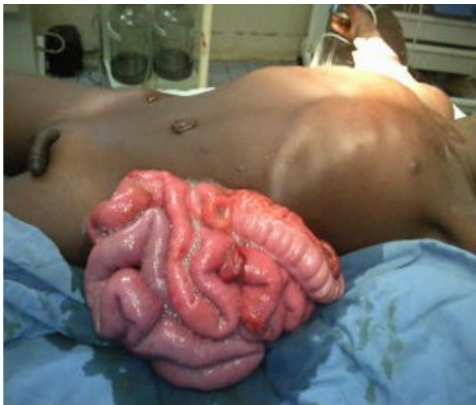
Figure 1 : éviscération traumatique par accident de la voie publique avec section de l'intestin grêle (flèches)

thoraco-abdominale ou abdomino-pelvienne chez 9,83% des patients. L'organe extériorisé était l'intestin grêle chez 23,52 % des patients, suivi de l'épiploon chez 11,76% des patients, du colon chez 5,88% des patients et de l'estomac chez 3,92% des patients. Les indications opératoires ayant conduit à une laparotomie non thérapeutique étaient l'éviscération chez 6 patients (extériorisation de l'épiploon chez 4 patients et extériorisation de l'intestin grêle chez 2 patients) et la péritonite chez 2 patients. La plaie abdominale était unique chez 78,43% des patients et multiple chez 21,57% des patients. La plaie était thoraco-abdominale chez 3,92% des patients et abdomino-périnéale chez un patient et chez 21,29% des patients elle intéressait en plus le compartiment rétropéritonéal (photo 2).