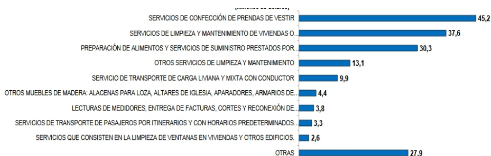
Gráfico 2. Principales rubros adjudicados a AEPS hasta agosto 2017