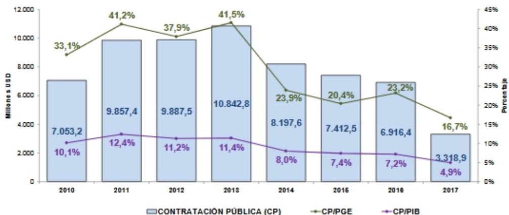
Gráfico 1. Porcentaje de la participación de la contratación pública