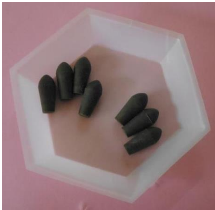
Figure 3: Suppositoires à visée antipaludique fabriqués à base du beurre de karité+4% de silice colloïdale et contenant Artemisia Annu cultivé à l’Ouest-Cameroun.