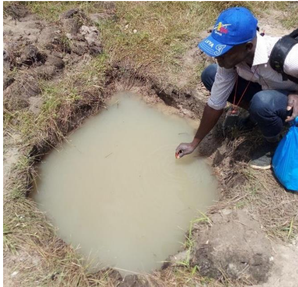
Figure 3. Aperçu d'un puits de prospection réalisé à Doumbiadougou.