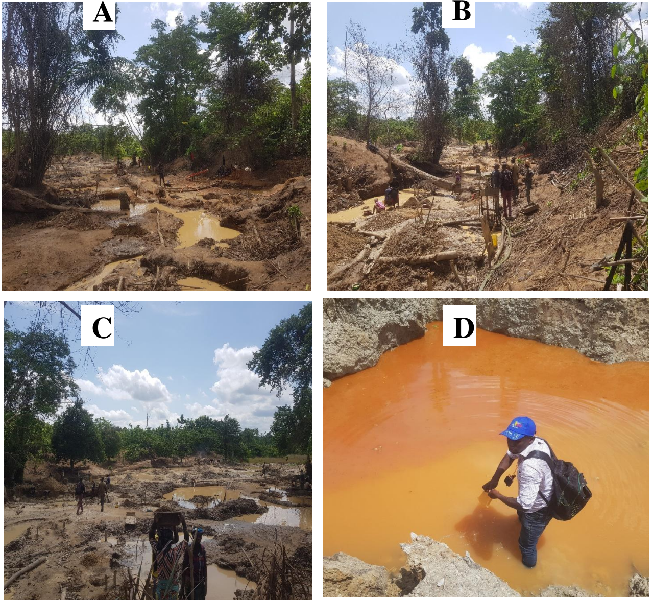
Figure 5: Dégradation du sol et des ressources en eau sur les sites d'activités artisanales de Doumbiadougou

utilisée dans le domaine de la prospection artisanale de l'or surtout lorsqu'il s'agit d'un gîte alluvionnaire comme c'est le cas des minerais exploités dans les bas-fonds de Doumbiadougou.