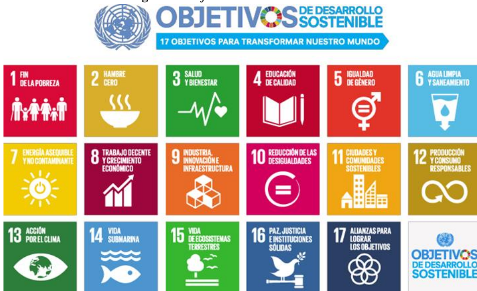
Figura 1. Objetivos de Desarrollo Sostenible

La Agenda 2030 entró en vigor el 1 de enero del 2016 y, con ello, la ejecución de un plan de acción y de estrategias con la meta y compromiso de aspirar a un mundo y futuro mejor. Lo anterior, se logró a través de la colaboración conjunta de los diversos actores y sectores sociales, entre los que destacan, el sector gubernamental, el sector académico, el sector empresarial y la sociedad civil organizada; en busca de asumir un papel activo y eficaz en la integración del plan y de las estrategias comunes enfocadas en la armonía, la paz y bienestar de las personas y del planeta (Muñoz-Torres, Fernández-Izquierdo, Rivera-Lirio, Ferrero-Ferrero, Escrig-Olmedo, Gisbert-Navarro, y Chiara-Marullo, 2018) (ver Figura 1).