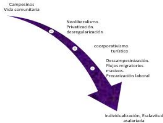
Diagrama del proceso de individualización

De acuerdo a lo anterior tenemos el siguiente diagrama 55