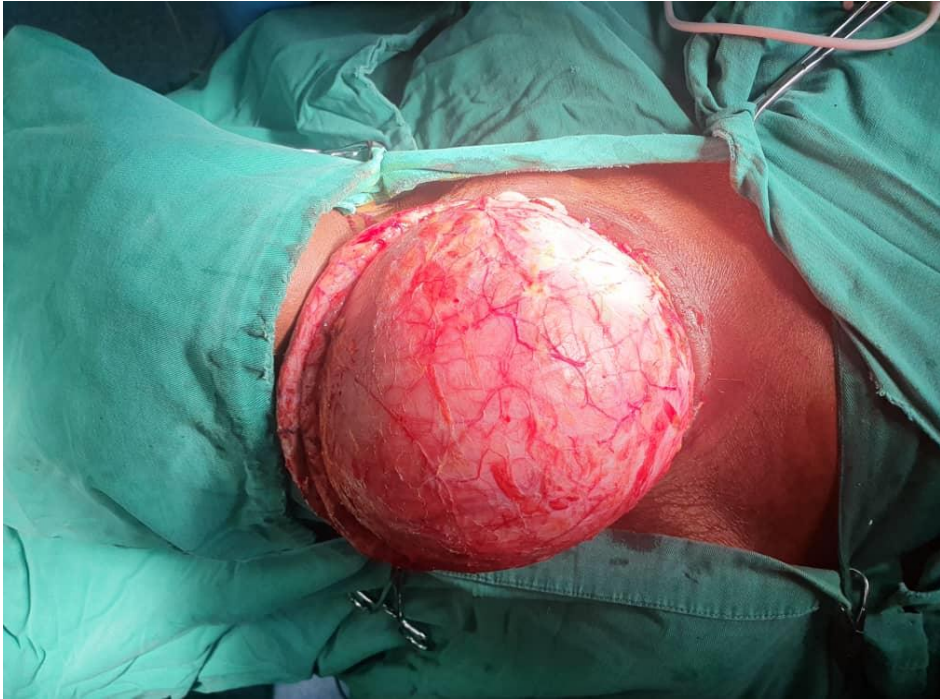
Figure 3. En cours de lobectomie droite, isthme et lobe gauche normaux et préservés, patiente A (image HGR)