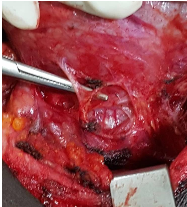
Figure 4. Nerf laryngé récurrent en arrière du pédicule vasculaire (HNN service de chirurgie générale)