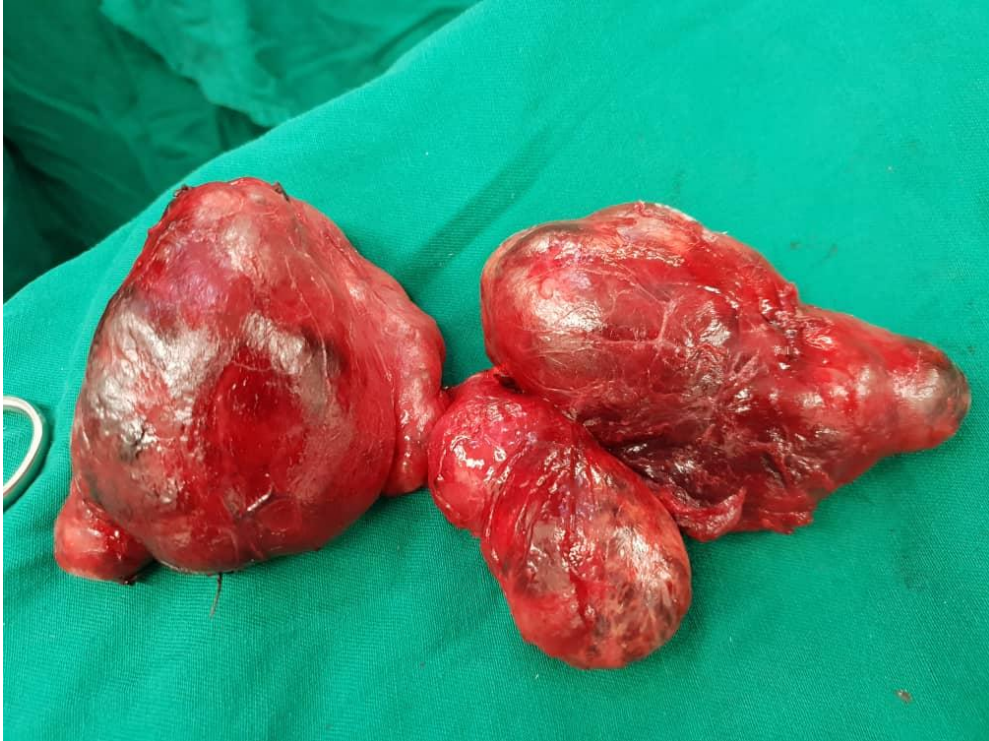
Figure 5. Pièce opératoire après une thyroïdectomie totale (HNN service de chirurgie générale A)