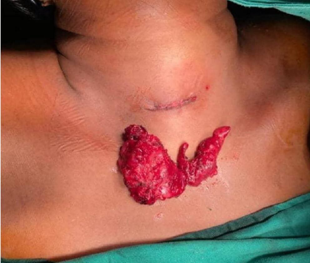
Figure 2. Pièce de thyroïdectomie vidéo assistée avec un mini abord cervical

Les complications postopératoires sont dominées par les paralysies récurrentielles avec 9 cas soit 2,13%. Le grade II était le plus représenté avec 14 cas soit 3,31%.