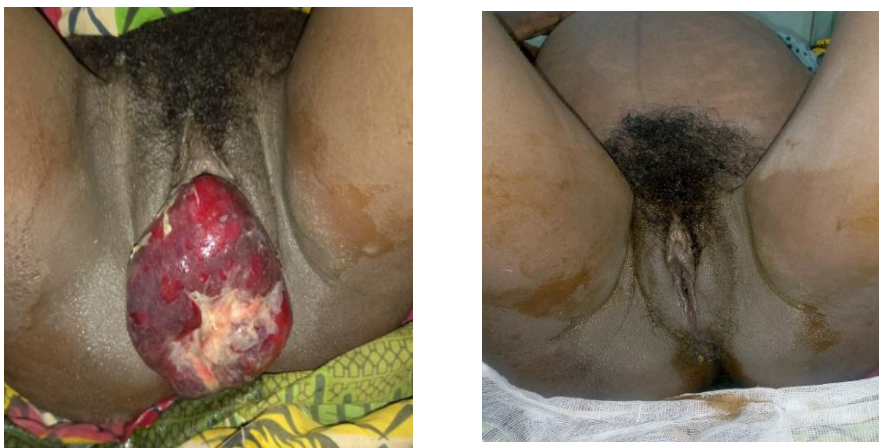
Figure 2. Prolapsus utérin stade III POP-Q à 37SA+4j (avant et après réduction manuelle)