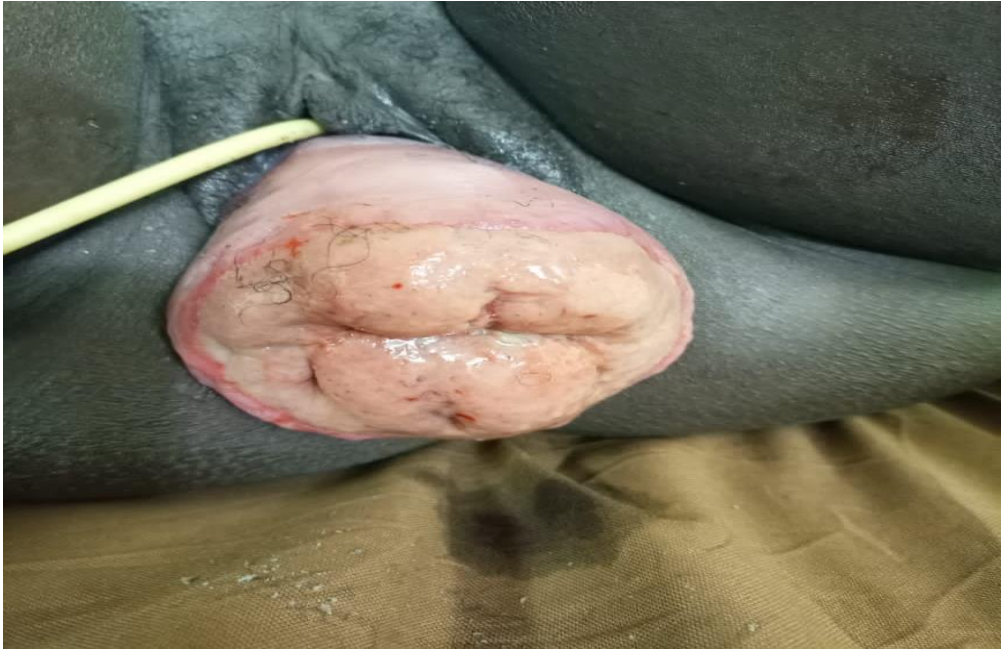
Figure 5 : Prolapsus utérin stade IV POP-Q à 37SA