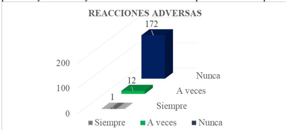
Figura 2. Reacciones adversas

El motivo más frecuente en que los entrevistados se automedican con Antiinflamatorios no esteroideos (AINES) son: el dolor. La participación de los usuarios respecto a los síntomas de enfermedades gastrointestinales refirieron a las diarreas como principal causa de automedicación. De los 185 participantes 98 mencionaron que “a veces” se automedican con antibióticos, lo cual refieren que son sobrantes de recetas anteriores (Figura 1), puesto que en México está regulado la venta de los mismos con receta médica. Sin embargo, se ha visto que existen algunos farmacéuticos que venden ciertos medicamentos sin receta médica (antibióticos), por lo cual la regulación está por las Leyes de Salud y la Norma Oficial Mexicana que deberá ser cumplidas.