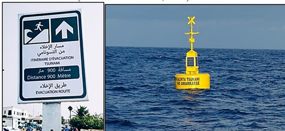
Figure 4 : Mesures de prévention contre le tsunami à El Jadida dans le cadre du projet CoastWave (a) : Panneau public indiquant les itinéraires d'évacuation (Lokhnati, 2024) ; (b) : Marégraphe au port de Jorf Lasfar (Lokhnati, 2023)

d'évacuation familial (Muttarak et Pothisiri, 2013).