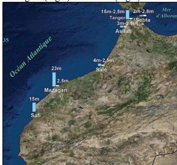
Figure 2 : Confrontation des sources et des témoignages historiques sur les effets du tsunami du Lisbonne en 1755 (Baptista et al., 2003 ; Blanc, 2009 ; Kaabouden et al., 2009)

Pour ce qui du Tsunami autant qu’impact des séismes, l’histoire a montré que le Maroc est menacé par ce risque. Le séisme du 1 er novembre 1755 à Lisbonne, né dans le golfe de Cadix, a provoqué un tsunami dévastateur ressenti dans tout le nord du Maroc, causant des dégâts considérables (Baptista et al., 1998 et 2003). Ce tsunami, le seul répertorié dans l’Atlantique Nord, est un événement de référence pour l’établissement de scénarios de risque dans la région (Quenet, 2005; Roger et al., 2010 et 2011). Il serait d’une grande importance d’inclure des informations sur ce tsunami dans les manuels des SVT sous forme de figure (Fig.2) ou de récit (Fig.3).