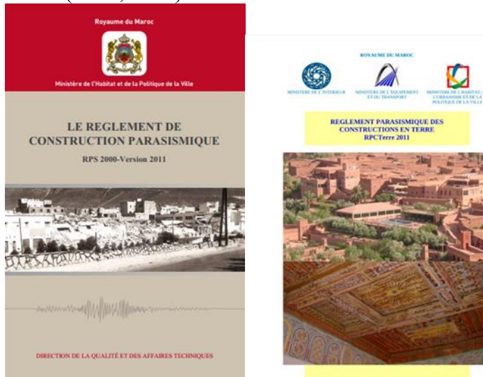
Figure 5 : Règlement de construction parasismique et Règlement parasismique des constructions en terre (MHPV, 2011).

pour sensibiliser activement les élèves et favoriser des comportements réduisant la vulnérabilité face aux catastrophes. En effet, les individus instruits sont mieux équipés pour réagir de manière appropriée en cas de catastrophe grâce à leurs compétences en résolution de problèmes et à leur capacité à planifier efficacement (Thomas et al., 1991 ; Moll, 1994 ; Glewwe, 1999 ; Ishikawa et Ryan, 2002 ; Schnell-Anzola et al., 2005) et la participation active des enfants apporte une valeur ajoutée, notamment en termes de résilience de la communauté (Amri, 2015).