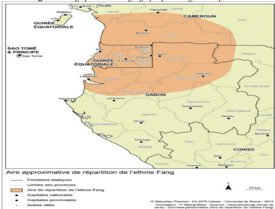
Image 2 : Cartographie de l'aire géographique Ekang en Afrique centrale