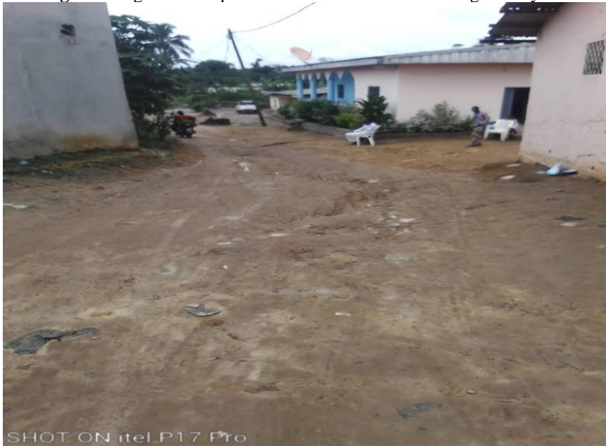
Image 4 : Péage instauré par le chef traditionnel de 3 ème degré de kyé-Ossi