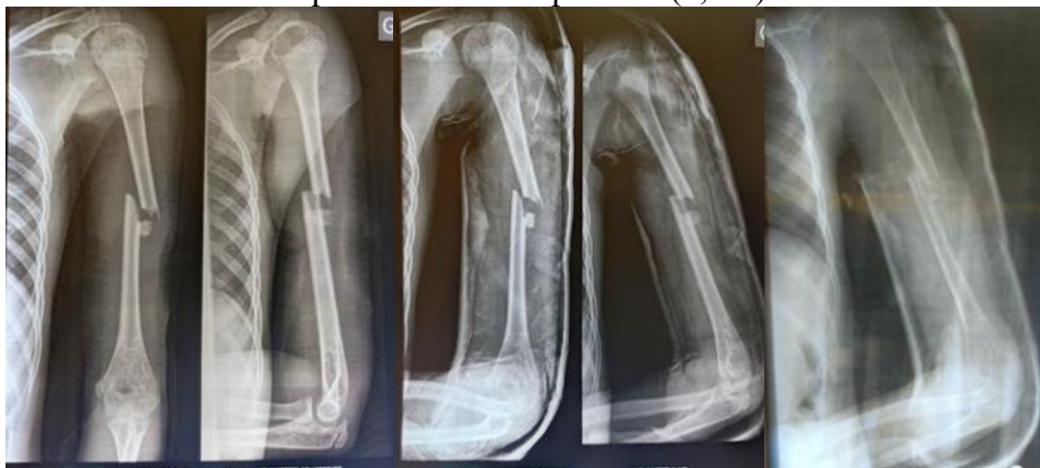
Figure 1 : A : fracture fermée déplacée tiers moyen diaphyse humérale gauche, B : Radiographie de contrôle post réduction, C : Radiographie de contrôle à 6 semaines post immobilisation

Les moyens orthopédiques étaient utilisés chez 146 patients (86,4%) et le moyen chirurgical chez 23 patients (13,2%). Concernant les moyens orthopédiques, la réduction suivie d'une contention plâtrée était réalisée chez 92 patients (54,4%) et un plâtre d'emblée était réalisé chez 55 patients (32,5%). La prise en charge chirurgicale était un brochage en croix chez 19 patients (11,2%) et l'ostéosynthèse par embrochage centromédullaire élastique stable chez 4 patients (2,4%).