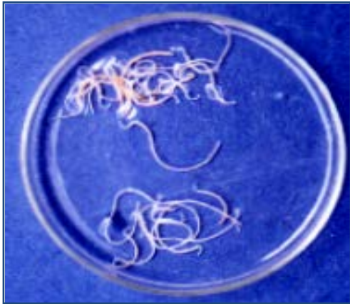
Fig.1 R. cadenati dans l'eau de mer

R. cadenati est pourvu d'un proboscis long cylindrique armé de 16 files longitudinales mené de 25 crochets dont la forme est simple présentant une très forte dissymétrie dorso-ventrale. Il assure la fixation du parasite à la paroi intestinale de l'hôte. Cependant, les espèces du genre Rhadinorhynchus sont considérées d'un point de vue pathologie comme des espèces non pénétrantes. Malgré la longueur du proboscis, la fixation et leur attachement ne provoquent que des lésions et les spécimens sont capables de se détacher pour changer leurs points de fixation le long de l'intestin.