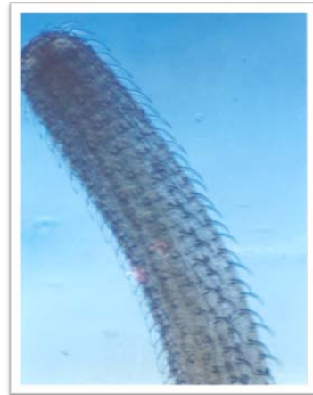
Fig.2 Rostre de R. cadenati dans le berlèze

L'examen d'individus fraîchement pêchés n'a révélé en aucun cas l'existence d'une perforation de l'intestin aboutissant la sortie de parasite ou au moins d'une partie dans la cavité générale comme c'est le cas de Pomphorhynchus françoise qui perce l'intestin de Trachinotus ovatus .