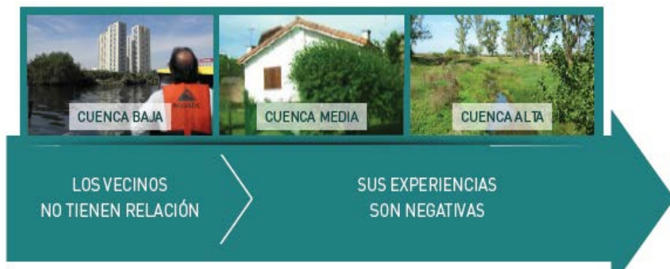
Fig. 2 Relación de los encuestados con el río.

Los encuestados que residían cerca del borde ribereño dijeron tener una relación negativa con el río debido al peligro de inundación y a las condiciones ambientales reinantes. Los más alejados manifestaron no tener relación alguna y se quejaron de la inseguridad. A pesar de ello, pensaron que el río podría usarse como sitio recreativo. La predisposición a colaborar en la limpieza, mantenimiento y control fue mayor en los encuestados domiciliados hasta 500 m de las riberas (84% para menos de 100 m y 76% entre 100-500 m) y se redujo a 51% para los más alejados (Fig. 3). Las mujeres residentes hasta 500 m de las riberas fueron significativamente más proclives a manifestar que estarían dispuestas a prestar ayuda que los hombres. Estas diferencias de género no se encontraron en los residentes más alejados.