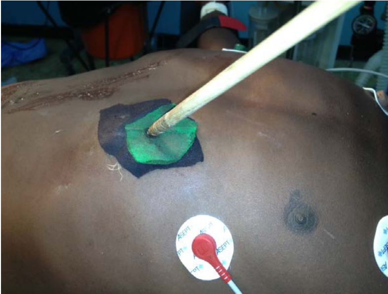
Figure 1 : plaie pénétrante de l'hypocondre gauche avec flèche en place.

flèches (Figure de 1 à 3), des pointes, des machettes.