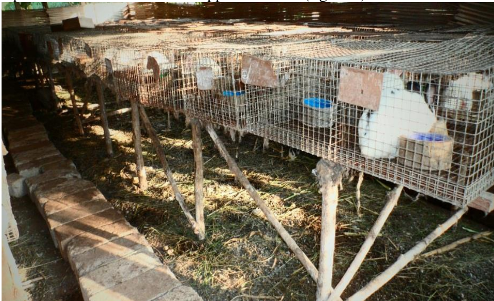
Figure 1. Vue interne du bâtiment d'élevage

L'expérimentation a été menée sur 120 femelles de race locale, réparties en quatre lots de mêmes effectifs (30/lot), de même poids ( P > 0,05 ) et comprenant autant de femelles nullipares que de femelles multipares. Chaque lot de femelle était identifiable au taux d'incorporation de feuilles de neem (FN) dans les aliments auxquels elles étaient soumises : N0 (0% FN), N5 (5% FN), N10 (10% FN) et N15 (15% FN). Les animaux ont été logés dans des cages grillagées de type mixte, de 0,34 m 2 . Ces cages étaient disposées en flat-desk sur des supports en bois (figure 1).