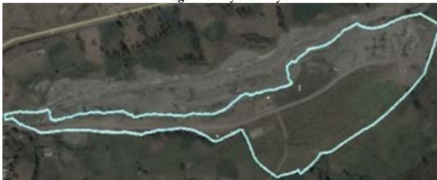
Imagen 1. Playa la Moya

Elaborado por el equipo de investigación