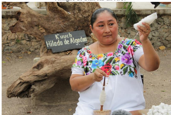
Foto 3. Demostración del hilado del algodón