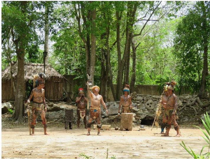
Foto 2. Danza prehispánica en la comunidad de Tihosuco

Durante este proceso se identificaron necesidades en la zona, sobre todo en las empresas comunitarias, dentro de las que se encuentran el fortalecimiento de la oferta actual de turismo comunitario. Es así, que en el año 2013 se presentó una propuesta de trabajo a la Fundación ADO dentro de la cual se planteó la conformación de una Red de Ecoturismo. Asimismo, el Corredor Biológico Mesoamericano (CBM) apoyó la creación legal de la Red de Ecoturismo con financiamiento durante los siguientes 40 meses.